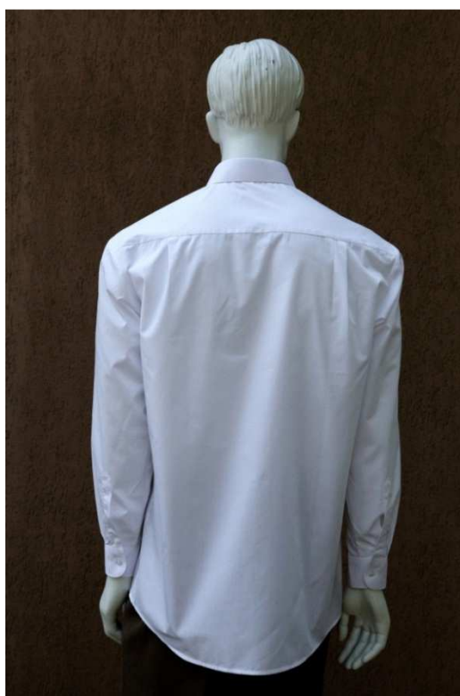
Fot. 2. Tył