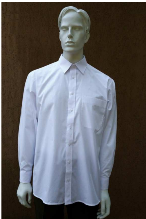
Fot. 1. Przód