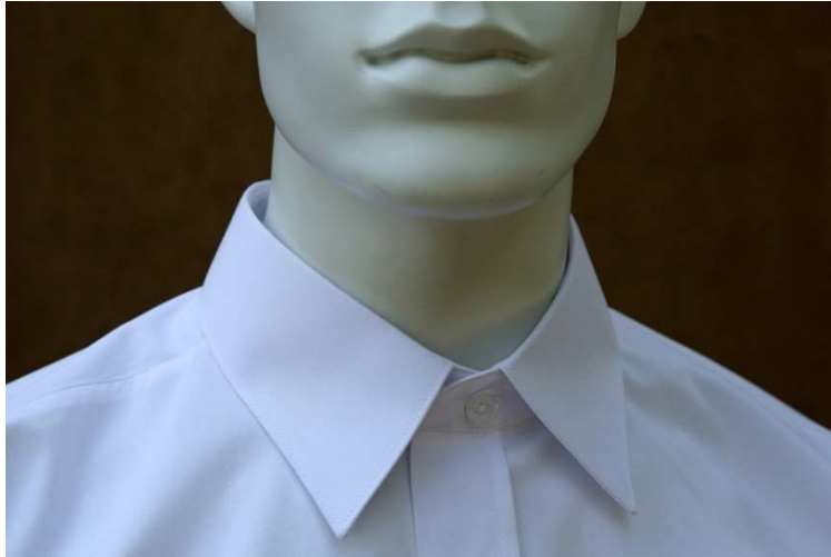
Fot. 3. Detale - kołnierzyk