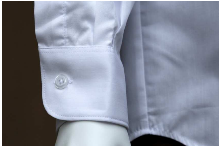
Fot. 4. Detale – mankiet