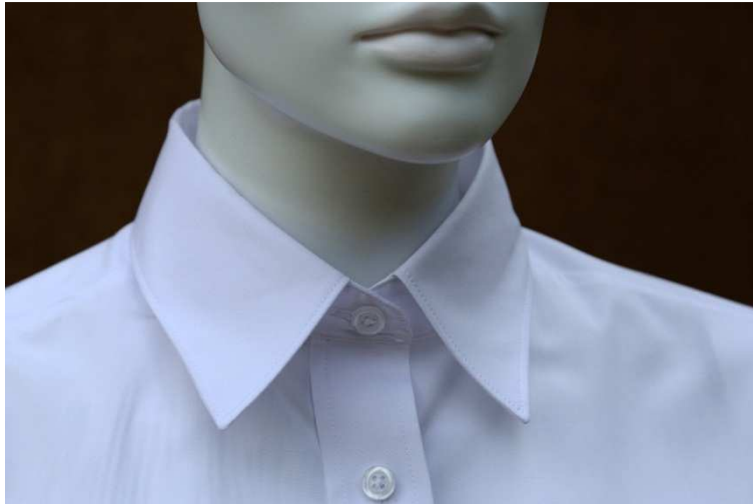
Fot. 3. Detale - kołnierzyk