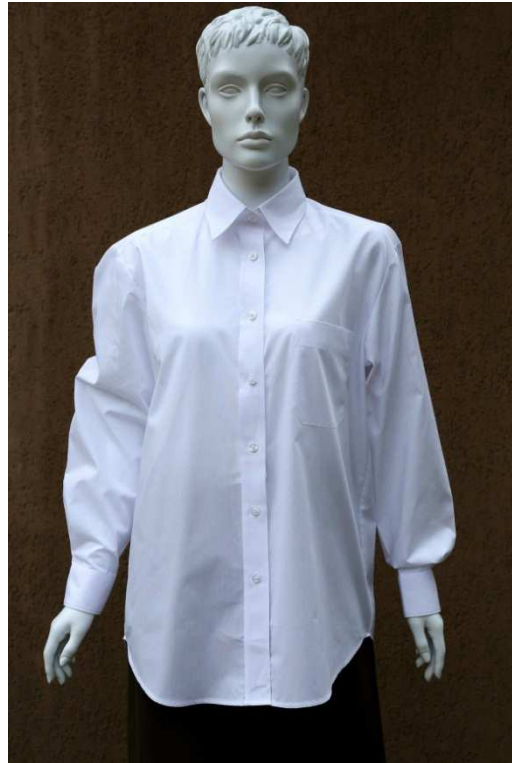
Fot. 1. Przód