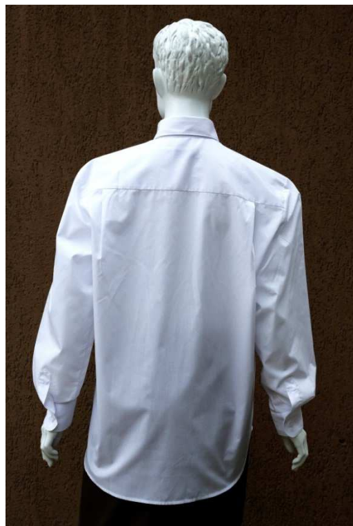
Fot. 2. Tył