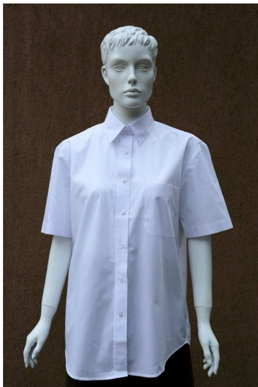
Fot. 1. Przód