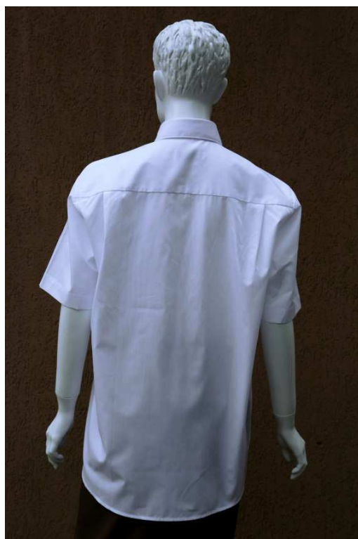
Fot. 2. Tył