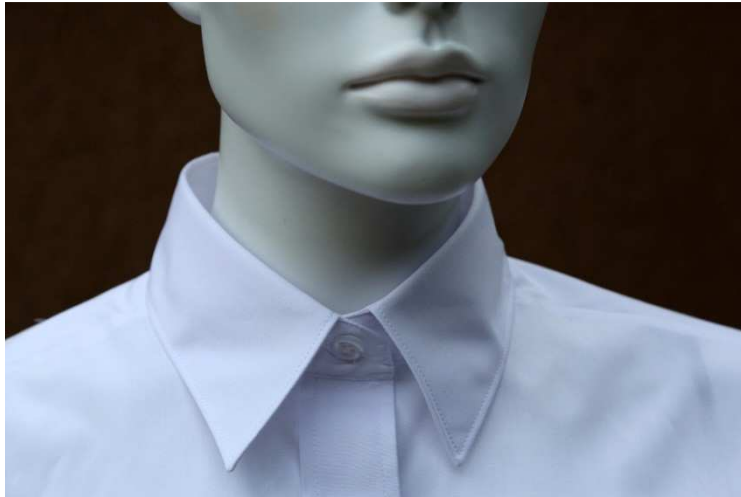
Fot. 3. Detale - kołnierzyk