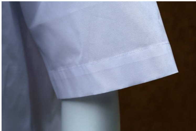
Fot. 4. Detale – wykończenie rękawa