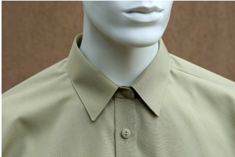
Fot. 3. Detale - kołnierzyk