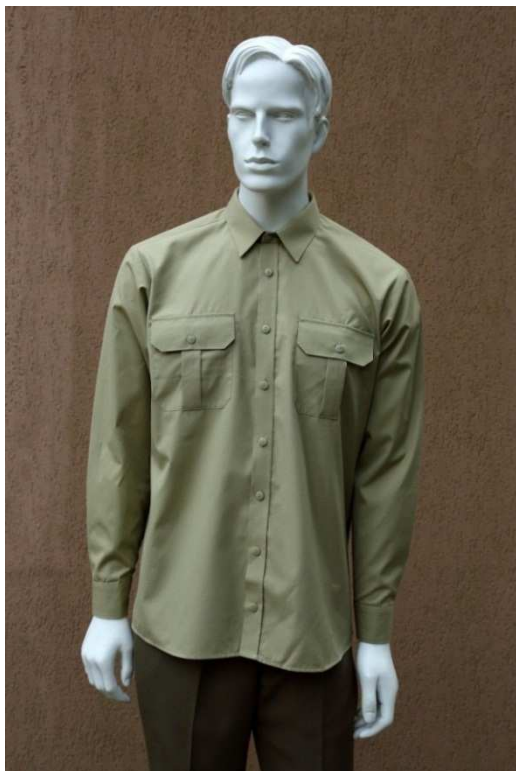
Fot. 1. Przód