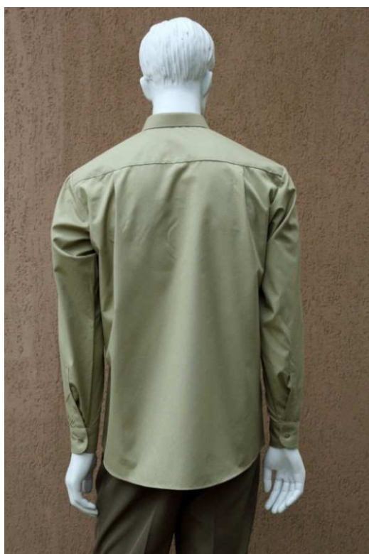
Fot. 2. Tył