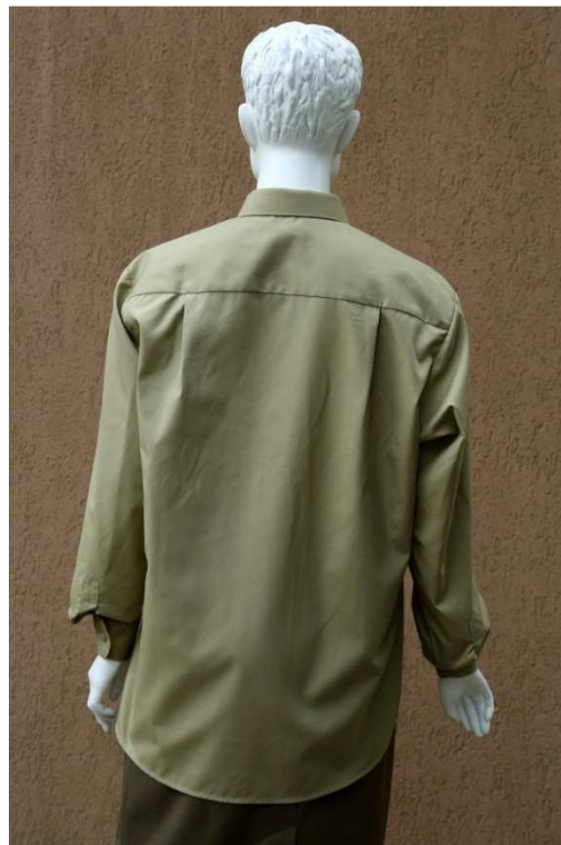
Fot. 2. Tył