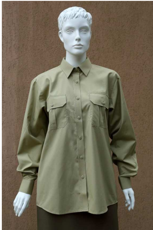
Fot. 1. Przód