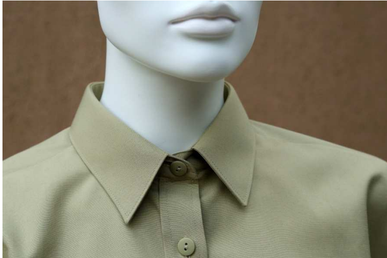
Fot. 3. Detale - kołnierzyk