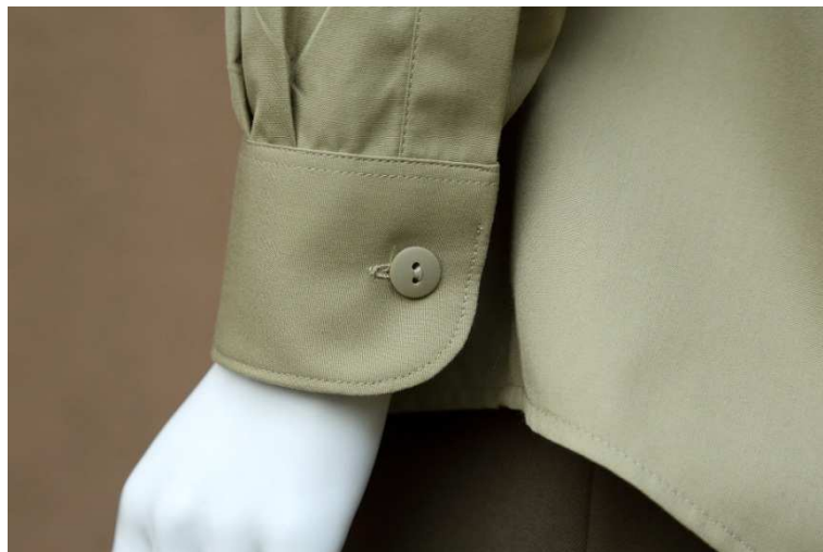
Fot. 4. Detale – mankiet